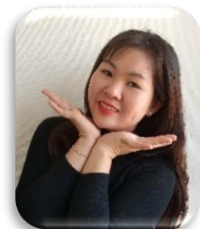
ズオン ティ ゴック マイ