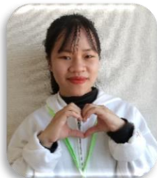
タイ ティ イエン