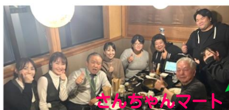
さんちゃんマート