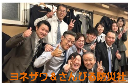
ヨネザワ&さんびも防災社