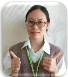
ゲン ティ ハン