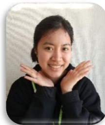
ゲン ティ ライン